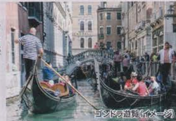
ゴンドラ遊覧(イメージ)

通常のツアーでは6人で1艘のゴンドラに乗りますが、当コースではお申し込み単位でのゴンドラ遊覧をお楽しみいただけます。