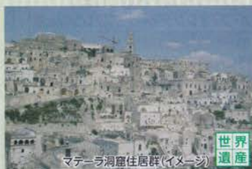
マテーラ洞窟住居群(イメージ)