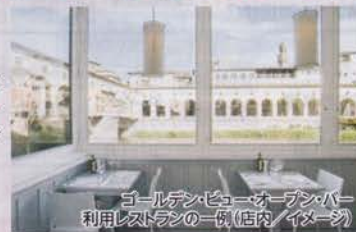
ゴールドen・ビュー・オープン・バー 利用レストランの一例(店内イメージ)