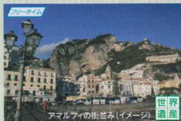
アマルフィの街並み(イメージ)

「サッシ」と呼ばれる洞窟住居が渓谷の絶壁にひしめき合う町。世界遺産に指定されている街並みは独特の雰囲気があります。