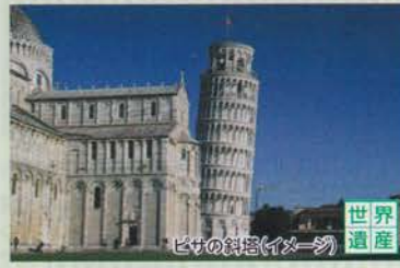
ピサの斜塔(イメージ)

世界最大級の収蔵数を誇るバチカン美術館。当コースではミケランジェロの大作「最後の審判」のあるシスティーナ礼拝堂にもご案内します。