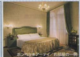
ボンベッキアーティ/お部屋の一例