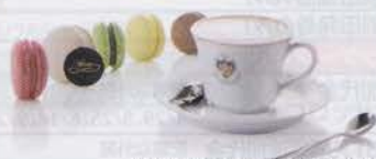
飲み物とマカロン5個(イメージ)

※クーポンはお1人様1枚を現地にて添乗員よりお渡しします。 ※クーポンの再発行および利用されなかった場合の払い戻しはできません。