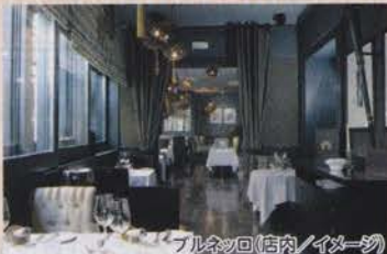
ブルネッロ(店内/イメージ)

5日目の夕食はルックJT8おすすめのGGレストラン(P.10・96参照)でお楽しみください。